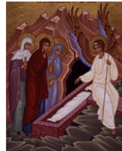
قبر خالی عیسی - شمایل کلیسای روس

پلین جوان، نویسنده ای که برای مأموریتی رسمی به بطنیا رفته بود نمی دانست با مسیحیان این سرزمین که از پذیرش آئین تحمیلی روم سر باز می زنند چه کند. با تراژان امپراتور مشورت می کند (حدود سال ۱۱۲ م.):