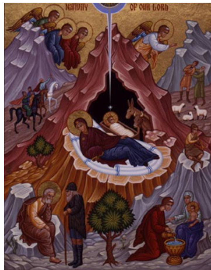
شمایل میلاد مسیح