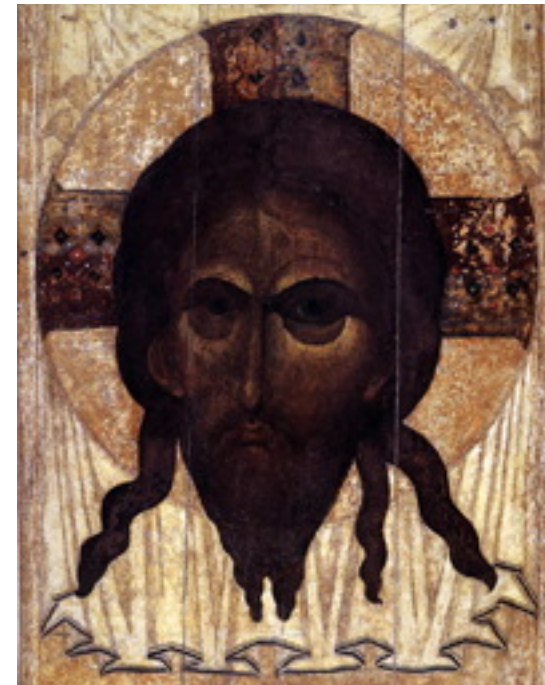
«آنکه مرا دید پدر را دیده است» (یوحنا ۱۲: ۴۵)

✠ عیسی اغلب شوخی می‌کند مثلاً در مثل خارق‌العاده خوک‌ها در سرزمین جدریان (مرقس ۵: ۱-۲۰). مشکل ما این است که لبخند عیسی را از ورای زبان، تصاویر و تفکری سامی که با زبان و تفکر کنونی ما متفاوت است تشخیص دهیم. چهار انجیل که اصلاً جنبه تاریخی ندارند و بر اساس ضوابط امروزی نگارش کتب تاریخی نوشته نشده‌اند بیش از آنچه که کاوش‌های امروزی در مورد محافل فلسطینی آن روزگار در اختیار ما قرار می‌دهند چیزی بیان نمی‌کنند. این انجیل که در ایمان نگاشته شده‌اند (واژه ایمان در زبان لاتین هم ریشه‌واژه امین می‌باشد)، علی‌رغم گوناگونی و تفاوت‌هایی که دارند عیسای تاریخی را با همان نیرو و خونسردی نشان می‌دهند که شاگردان امروزیش ادعا می‌کنند