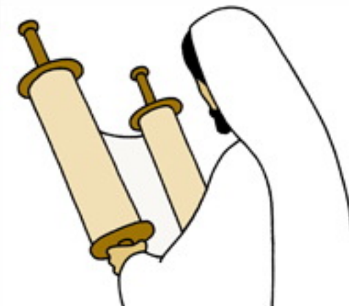
«در کنیسه تعلیم دادن آغاز نمود»

عیسی برادر جاودانی من است که تا وقتی که در پی‌اش روان هستم دستم را در دست خود می‌گیرد. دستی که اثر زخم بر خود دارد دست مسیح نیست. این دست زخمی یقیناً دستی الهی نیست، بلکه یک دستی انسانی است، دستی که درد و رنج عمیق بر خطوطش نقش بسته. این دست شخصی است که شاهد بزرگ ایمان بنی اسرائیل است. ایمان بی‌چون و چرا، اعتماد کامل به خدای پدر، تمایل به تسلیم محض اراده پدر بودن، آری عیسی اینگونه زندگی کرد و بدین ترتیب است که می‌تواند ما مسیحیان و یهودیان را با هم متحد سازد. ایمان عیسی ما را متحد می‌سازد اما ایمان به عیسی ما را از هم جدا می‌کند (شالوم بن کورن Schalom Ben-Chorin ۱۹۶۷).