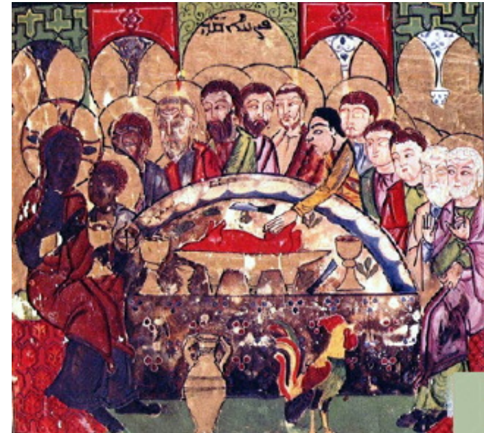
شام آخر، شمایل سربانی سال ۱۲۲۰ م

دایره شاگردان: دایره اتحاد از مسیح آغاز گشته و به سوی او برمی‌گردد، بدین معنی که مسیح راز خود را به شاگردان عطا می‌کند و در اوست که راز کلیسا به کمال می‌رسد: این است ثمره عشاء ربانی.