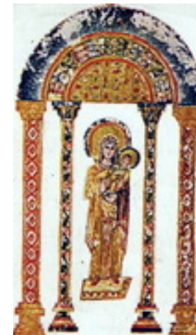
شمایل سریانی، مریم عذرا سال ۵۸۶ میلادی

تصویر کشیده شده است، ولی نمونه های این شمایل ها مشخص می باشند و عناصری نیز که در این شمایل ها متغیر هستند، مشخص اند.