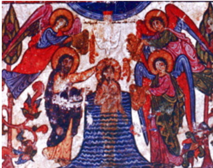
تعمید مسیح، شمایل سریانی قرن ۱۳

" همه شما که در مسیح تعمید یافتید، مسیح را در برگرفتید... " (غلا ۳: ۲۷)