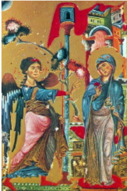
مژده به مریم، شمایل ارمنی قرن ۱۳

درود بر تو ای مریم ای سرشار از فیض خدا با توست تو در بین زنان مبارک هستی و مبارک است ثمره بطن تو! (لو: ۱: ۲۸ و ۴۲)