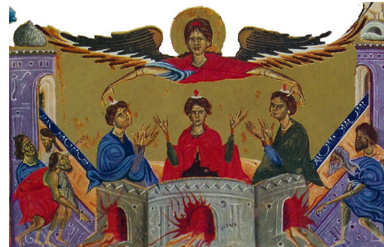
سه جوان در کوره آتش، شمایل ارمنی قرن ۱۲۸۶