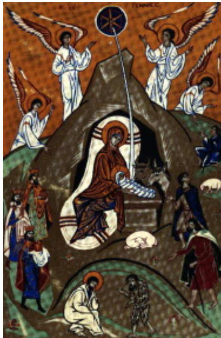
تولد مسیح، شمایل بیزانتین قرن ۱۶

"مسیح متولد می‌شود، او را جلال دهیم مسیح از آسمان نازل می‌گردد، به ملاقات او برویم مسیح بر روی زمین است، ای تمام ملت‌ها بگذارید شادی شما بدرخشد."