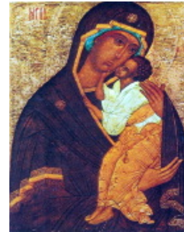
مادر خدا، شمایل روسی قرن ۱۳