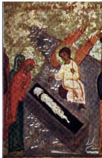
شمایل روسی قبر خالی قرن ۱۶ م