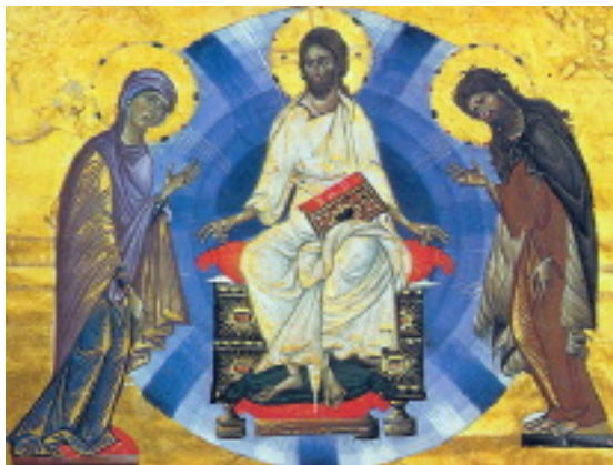
شمایل قادر مطلق، شمایل ارمنی قرن ۱۳

* شمایل موسوم به "مسیح قادر مطلق" (کسی که تمام قدرت در آسمان و بر زمین به وی واگذار شده است)، نمونه ای از هنر "بیزانتینی" می باشد که قسمت داخلی بسیاری از گنبد های کلیساها را می آراید.