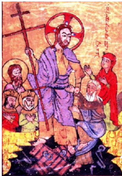
فرو رفتن عیسی در هاویه، شمایل سریانی سال ۱۲۲۰ م

در شمایل بیزانتینی دایره آبی سبزفام که دور سر مسیح را احاطه کرده است بیان گر الوهیت او و لباس سفیدش نشانه جلال خدایی است (همانند لباس های سفید در شمایل "تجلی").