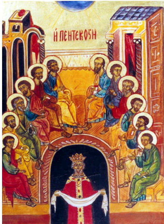
پنطیکاست، شمایل روسی قرن ۱۵

پطرس همیشه قابل شناسایی است: او دارای موهای سفید و مجعد و ریشی مدور است. پولس نیز مشخص است: او دارای سری کم مو و ریشی قهوه‌ای می‌باشد هرچند که از نظر تاریخی جای وی آن‌جا نیست! و هم‌چنین لوقا و مرقس نیز با این که از نظر تاریخی جایشان در آن‌جا نیست، گاهی در این شمایل حضور دارند چون در این شمایل حضور تمام کلیسا نشان داده می‌شود.