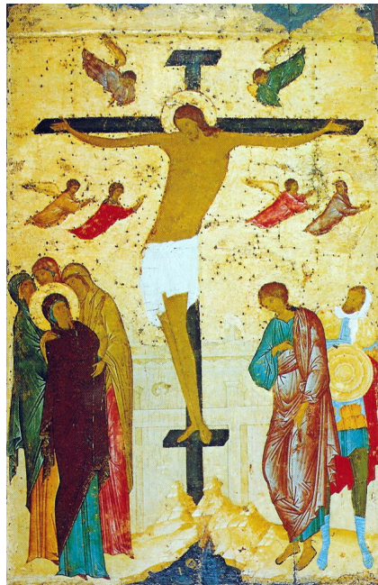
تصلیب، شمایل روسی قرن ۱۵

عیسی مسلط است زیرا با وجود بی‌حرکت بودن جسد که توسط بسته بودن چشم‌ها نمایان می‌گردد، بر چهره عیسی حالتی از صلح و صفا و حتی پیروزی نقش بسته است زیرا: "او با مرگ خود بر مرگ غلبه کرد." بدن او