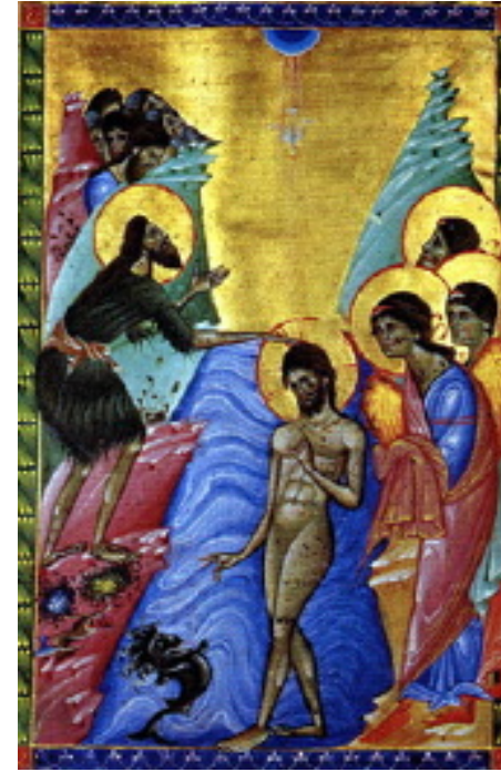
تعمید مسیح، شمایل ارمنی قرن ۱۳

ای خداوند، خدای ما تو را که انبوه فرشتگان بی وقفه جلالت را می سرایند، ستایش می کنیم به تو ای که به خاطر محبت، خود را خوار نموده به سرشت ما در آمدی امید می بندیم خود را به دست شفقت و رحمت تو می سپاریم عطایای خود را بر قلوب ما بگستران چون تو یگانه نیکویی، و یگانه دوست انسان‌هایی.