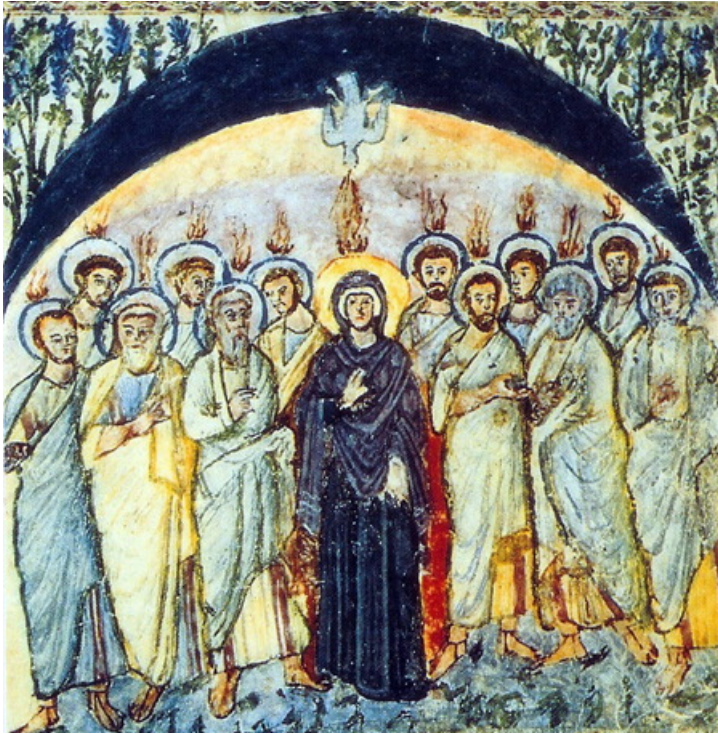
بنطیکاست، شمایل سریانی قرن ۶

بر روی برخی شمایل دیگر، کمی بالاتر از این صحنه، حضرت مریم در حالی که باز به شکل طفل قنداق شده ای ترسیم شده است، توسط فرشته ای که دستانش به نشانه احترام پوشیده است، وارد بهشت می‌گردد. جلال یافتن مادر مسیح خداوند ما، وعده جلال یافتن همه بازخیرشدگان است.