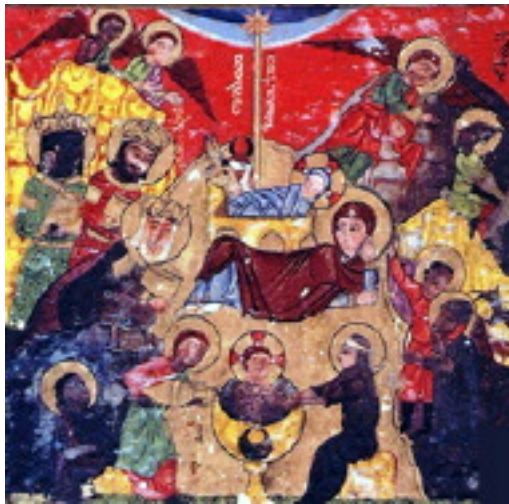
تولد مسیح، شمایل سریانی قرن ۱۳

شمایل نگاران بسیاری صحنه تولد نجات دهنده را به تصویر کشیده‌اند. شمایلی که آن را مورد تعمق قرار می‌دهیم (ر.ک ص ۲۱)، متعلق به مکتب آندره روبلف (قرن شانزدهم) می‌باشد.