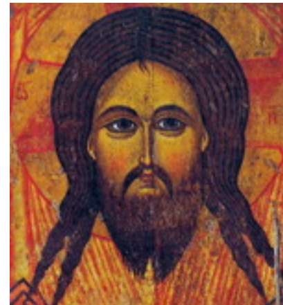
شمایل روسی قرن ۱۳

شمایل‌نگاری به احتمال قوی در منطقه سوریه - فلسطین که مهد مسیحیت می‌باشد به وجود آمده و از هنرهای باستانی، نقاشی‌های روی دیوار، مینیاتورها و از نقاشی‌های روی قبور سنگی مصر، بسیار الهام گرفته است.