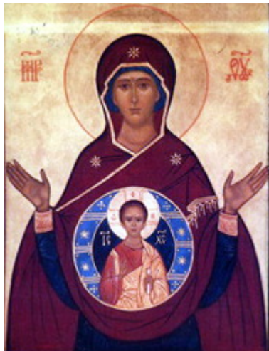
شمایل روسی عذرای آیت (مریم بسیار مقدس)