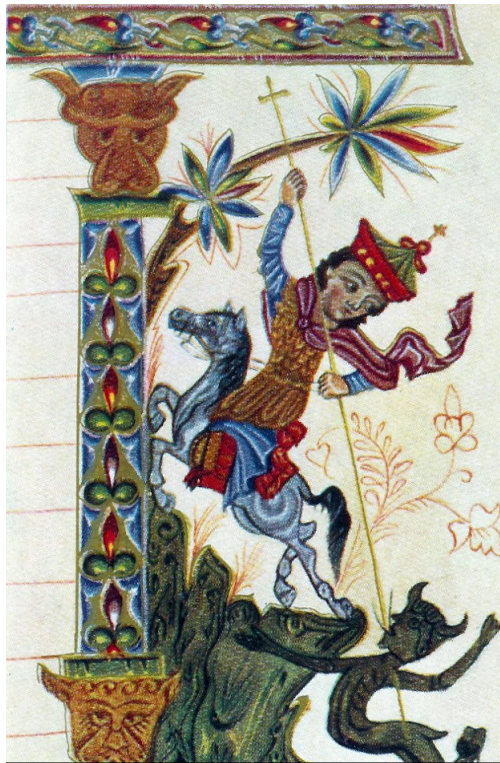
گیورگیز قدیس، شمایل ارمنی قرن ۱۴

شمایل ژرژ قدیس که نام دیگرش شمایل "ژرژ قدیس و قاتل اژدها" می‌باشد، نمایش دهنده افسانه‌ای یونانی که ریشه آن به آیین‌های ماقبل مسیحیت بر می‌گردد. ژرژ قدیس اژدهای هولناکی را که فقط از راه قربانی انسان سیر می‌شود، بر زمین می‌کوبد. این اژدها نشان‌گر قدرت بدی یا شیطان است که طبق انجیل آدم کش می‌باشد و تنها مسیح مصلوب بر او پیروز است.