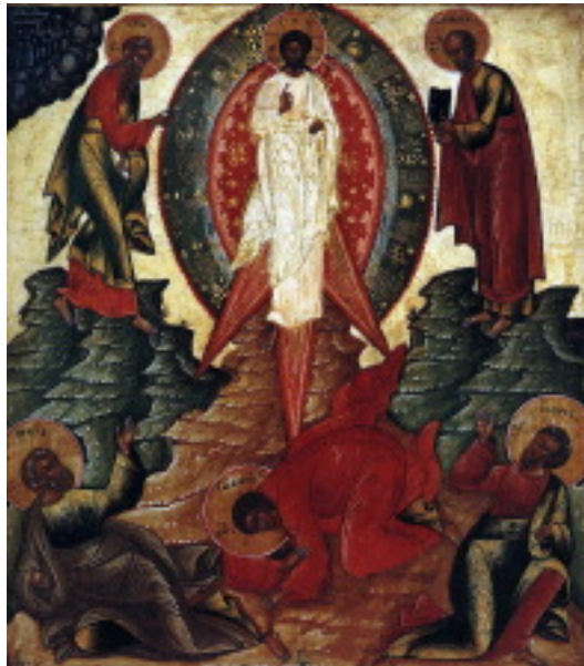
تجلی مسیح، شمایل روسی قرن ۱۵

اولین شمایل "تجلی"، شمایلی روسی می‌باشد که این اثر در ابتدای قرن پانزدهم خلق شده است.