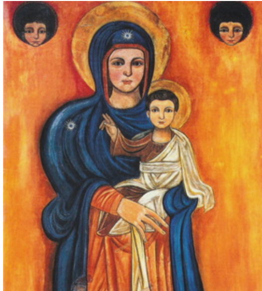
عذرای دیر ایلچ، شمایل قرن ۸

با استفاده از این شمایل حیرت‌انگیز می‌توانیم منبع پیدایش چندین شمایل را در سنت کلیساها درک نماییم. پیدایش دوره اعیاد خداوند، از قرن چهارم، طبق عادت، به زیارت سرزمین مقدس یعنی محل وقوع اتفاقات زندگی مسیح باز می‌گردد. این امر نمایان‌گر اهمیت کلیسای اورشلیم و به خصوص دیر حضرت صبا در دره قدرون است، جایی که راهبان ضمن پیروی از کتاب مقدس برای خلاقیت روحانی موجود در نوشته‌های تحریفی نیز اهمیت قائل بودند. این منبع الهام اغلب اوقات در موضوع شمایل‌هایی که کاملاً وابسته به متون آیین عبادت می‌باشند، منعکس گشته است.