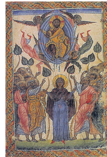
صعود، شمایل از صومعه تورعبدین سال ۱۲۲۲ میلادی

در پایین: گروه مریم عذرا و رسولان قرار دارند، یعنی نور مسیح که از این پس نامرئی می‌باشد، تماماً کلیسا را در برمی‌گیرد. مسیح با حرکات دست، تمام برکات را بر کلیسا می‌افشاند. بعضی اوقات در حرکتی متقابل دست‌های برافراشته فرشتگان به آسمان اشاره کرده و انسان را به ایمان و امیدواری دعوت می‌کنند.