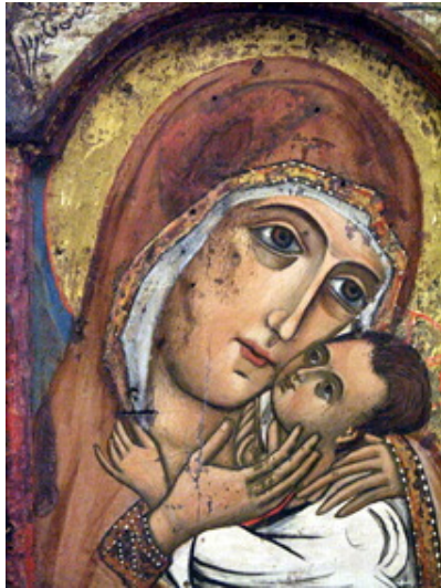
شمایل مریم رئوف، قرن ۱۲

* بار دیگر شمایل حضرت مریم را در بالاخانه یادآوری می کنیم، که همراه با رسولان در انتظار نزول روح القدس به نیایش مشغول است. آیا او نمی تواند برای همه آنانی که در مصاحبت و گفتگوی برادرانه خواهان عمق بخشیدن به اطاعت خود در ایمان می باشند، نشانه امید باشد؟ پاپ اعظم ژان پل دوم (رساله مادر نجات دهنده شماره ۳۳)