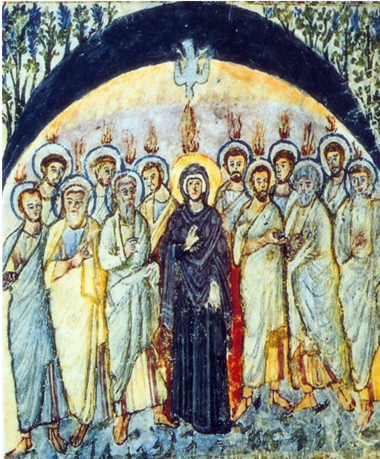
شمایل سربانی نزول روح القدس سال ۵۸۶

فرشته: فرشته خطاب به مریم و هم‌چنین به ما راز تن گرفتن خدا را اعلام می‌دارد. از طریق این راز، محبت و حکمت خدا از میان ضعف و فروتنی مریم که صفات همه انسان‌ها نیز می‌باشد مکشوف می‌گردد.