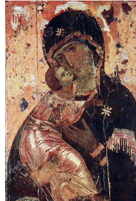
مادر خدا، شمایل روسی قرن ۱۲

حضرت مریم: حضرت مریم تن پوشی به رنگ تیره در بردارد، بدین معنا که او متعلق به زمین است. اما این لباس دارای حاشیه طلایی است که چند واقعیت را می‌رساند: اول آن که بیان‌گر جلال یا تقدس آن کسی می‌باشد که "پراز نعمت" خداست. دوم آن که نور آسمانی در تمام وجود حضرت مریم نفوذ کرده است.