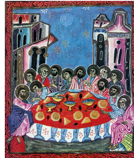
شام آخر، شمایل ارمنی قرن ۱۳، مقارن با فتوحات مغول‌ها

(از نماز کلیسای آشوری - دعای قبل از تناول تن و خون مسیح)