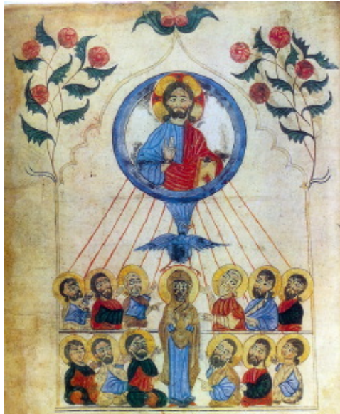
صعود مسیح و نزول روح القدس، شمایل ارمنی قرن ۱۴

برخی از شمایل‌های پنطیکاست ملهم از اعمال رسولان (باب ۲) دارای طرحی بسیار مشخص، تحت تاثیر آیین عبادت می باشند. رسولان به طور دایره وار قرار گرفته اند و در بعضی از شمایل‌ها بین آن‌ها یک جای خالی به چشم می خورد که جای خداوند است که مورد انتظار می باشد و به ندرت حضرت مریم در آن جای دارد، اما بیشتر اوقات وی حضور ندارد. همیشه در بالای شمایل یک سرچشمه نورانی وجود دارد: خورشید یا ستارگان و بعضی مواقع کبوتری نیز به چشم می خورد و گاهی اوقات خیر. در بعضی موارد شعله‌هایی به رنگ طلایی یا نارنجی روی سر هر رسول دیده می شود.