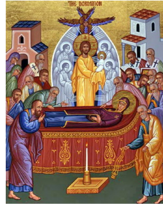
رحلت حضرت مریم، شمایل روسی قرن ۱۶

مریم بر روی بستری آرامیده نمایش داده شده است، در حالی که رسولان و فرشتگان گرداگرد او را فرا گرفته اند مسیح آمده است تا روح مادرش را که به شکل یک نوزاد قنداق شده است در دستان خود بگیرد؛ مرگ تولدی نوین است.