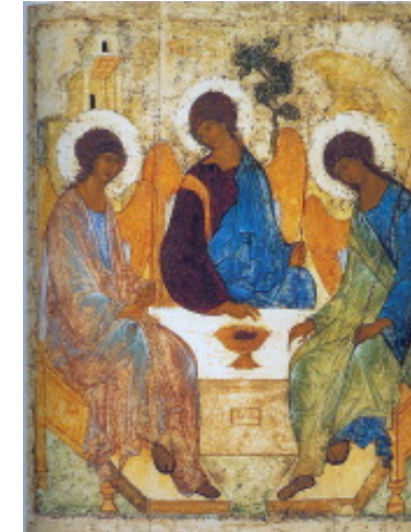
سه گانه اقدس، شمایل روسی قرن ۱۵