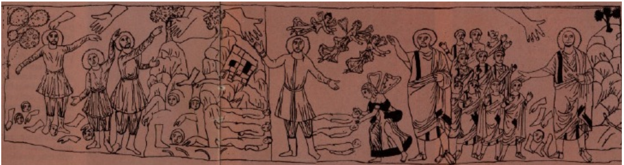
شش صحنه از رؤیای حزقیال نبی باب ۳۷: ابتدا جسد‌ها از نو شکل گرفته (سمت چپ) و به تدریج احیا می‌شوند (سمت راست) (کنیسه دورا-اورپوس در کشور سوریه، حدود سال ۲۵۰ میلادی).

و زمین مردگان خود را بیرون خواهد افکند. (اش ۱۹:۲۶)