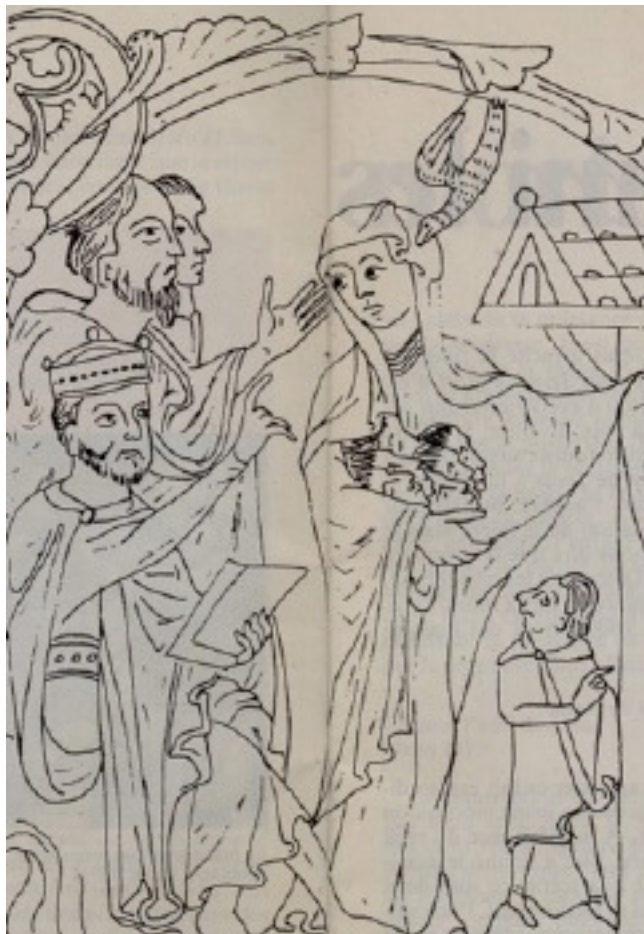
مادر هفت برادر شهید (قرن ۱۲ میلادی)